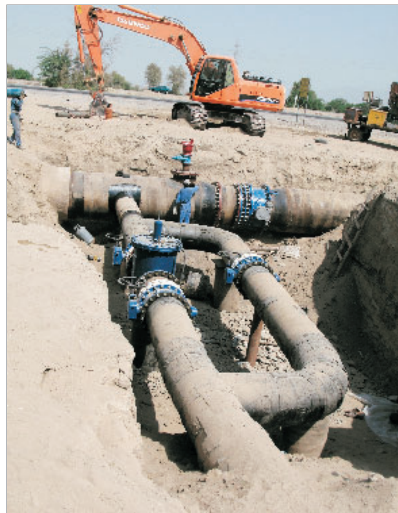
با حضور وزیر نیرو انجام شد